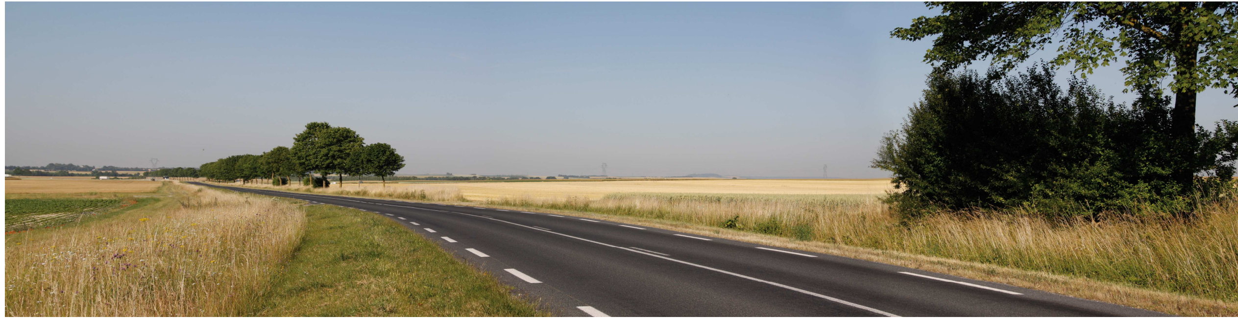
Le site actuel