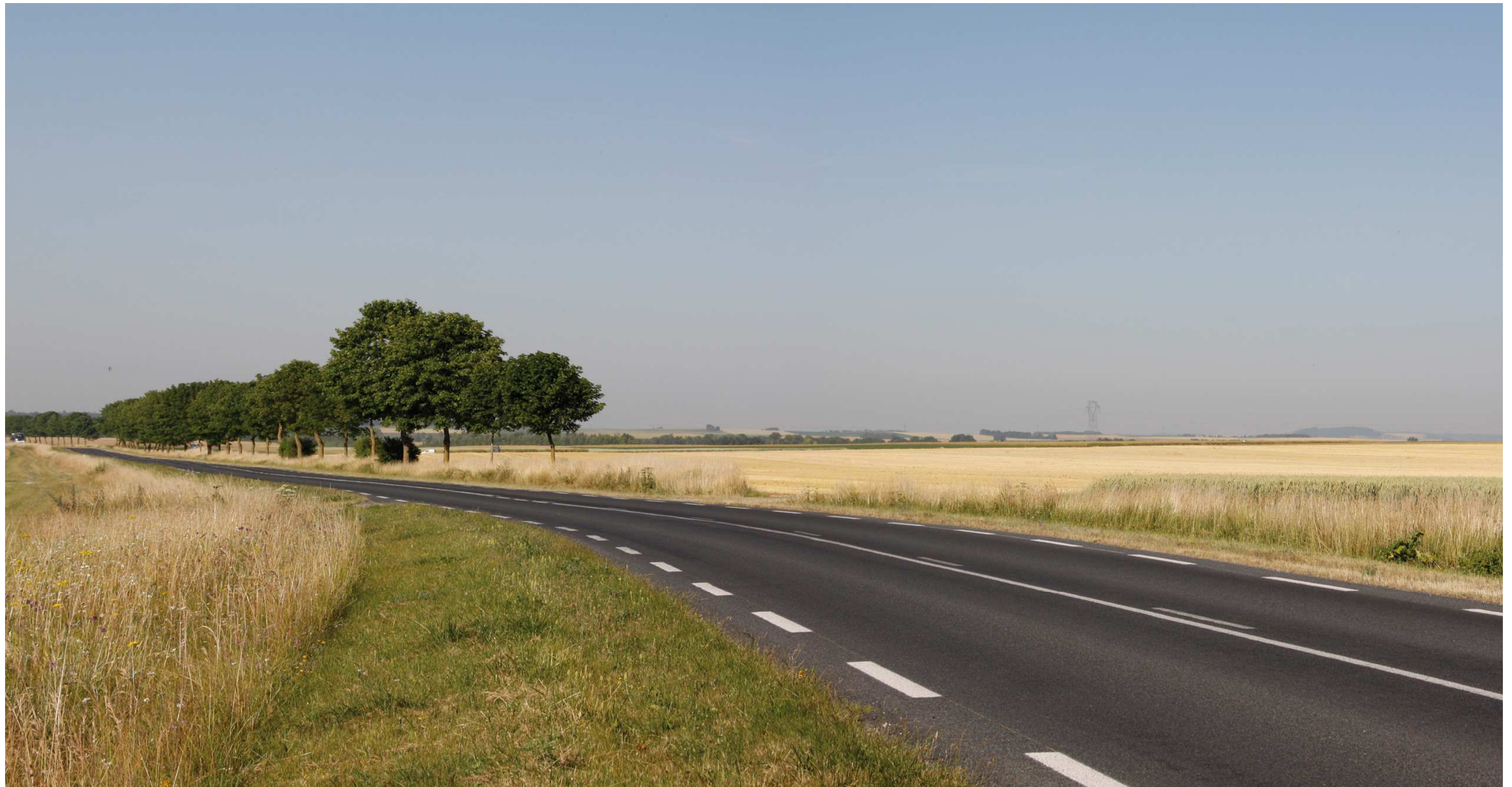
Le site actuel